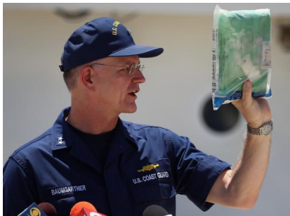
El contralmirante William Baumgartner, comandante del Séptimo Distrito de la Guardia Costera, muestra un fardo de cocaína incautado por la tripulación del escampavía Bernard C. Webber junto con 2,200 libras durante la Operación Martillo, el 26 de abril de 2013.

Pantalla Completa Imagen 1 de 2 anterior | próxima